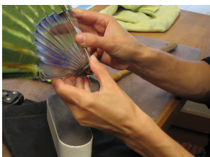
Atelier de l'éventail